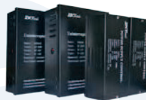
Fuente de Poder