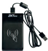
Enrolador de Tarjetas